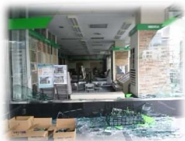
仙台支店 1F ロビーの様子

3月15日に出発した第2チームは3月15日、活動拠点としている米沢河鹿荘に入り、翌16日、被災地へ救援物資を届けました。