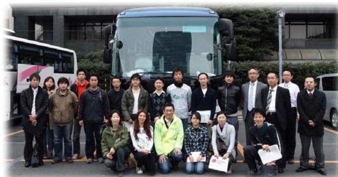
第1次ボランティアチーム出発風景

グループ内従業員有志によるボランティアチームが発足し、社も全面協力しました。第1次ボランティアチームは被災地へ向け出発。余震の影響で、目的地のボランティアセンターでのボランティアは一時中止されるものの、宿泊先大松荘様周辺のお手伝いを実施しました。余震はなおも続き、チームの判断により安全を優先し、一時米沢へ宿泊先を変更しました。いったん米沢に移動させた宿泊先ですが、少しでも活動しやすくするため、宮城県仙台市の岩沼屋様へ変更しました。