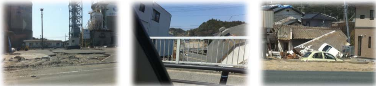
福島県沿岸部の様子

福島原発事故による緊張が続く福島県内において支援を行いました。いわき市街地では地震による被害は沿岸部と比較すると確かに少なく見えました。しかし、港近隣はやはり目を覆いたくなる惨状が広がっているのが現実でした。いま、復旧へ向け懸命の活動が続いています。このような状況の中、福島原発を抱え余震が続き、断続的な断水に加え停電など、精神的なストレスは想像を絶します。ある従業員のご家族は、「日中一人で常に恐怖を抱きながら生活している」と語っていました。そんな中、従業員へは家族を含めたメンタルヘルスの案内を行い、被災地へ支援物資を届けた後、いわきにおける現状を肌で感じながら無事、翌4月14日に帰京しました。