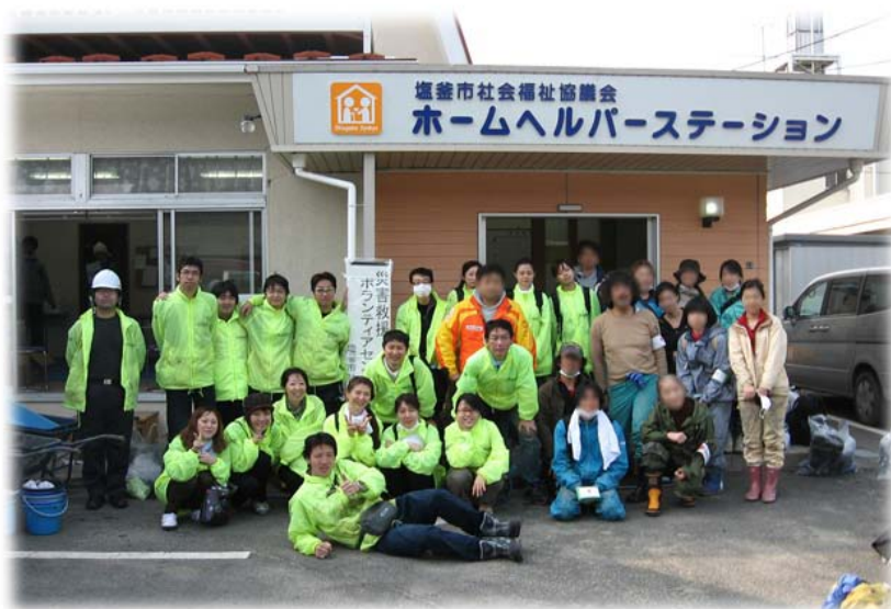
ボランティアセンターの方々との集合写真

2011年4月15日(金) グループ会社において黙祷を捧げ、義援金を募集 全グループ会社において黙祷を捧げ、義援金の募集を開始いたしました。