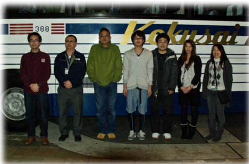
第3チーム出発風景

従業員が持ち寄った日用品と追加救援物資の被災地への運搬。および、当社各グループ会社における復旧活動の応援、従業員一時帰省の協力。そして被災地におけるボランティア受け入れ状況の確認などを目的とし、被災地へ向け出発しました。