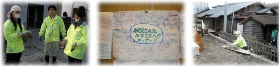
塩釜ボランティアセンターとボランティア活動風景

当社グループ従業員による有志のボランティアチームの立ち上げにあたり、現地のボランティア受け入れ状況の確認と実際の作業について情報を得るため、塩釜市災害ボランティアセンターを訪問しました。その際にボランティア活動に参加させていただきました。