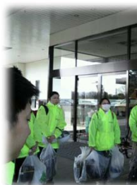
ボランティア活動魔の朝礼風景