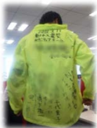
ジャンパーへの寄書

第1次ボランティアチームチームリーダーは、「ボランティアとはどこまでを言うのか？現場での作業、サポートいただいた会社の方々、心配する家族、友人、お世話になった旅館の方々、様々な人の協力があってこそ成り立つもの。役割は違っても皆が主役であり、一人ひとりがやれることをやればよい」と締めくくってくれました。