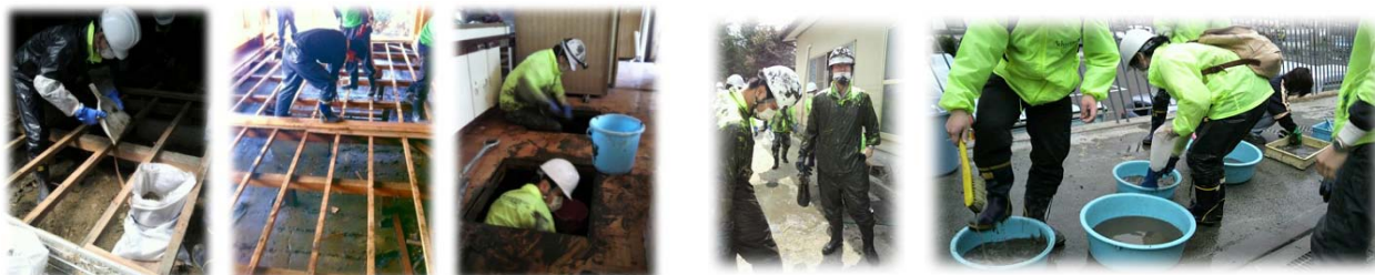
ボランティア活動の様子

4月11日(月)大震災発生より1ヵ月が経過したこの日から、チームは本格的ボランティアを開始しました。第1次ボランティアチームメンバー15名すべてが1軒のお宅にて、泥だし・片付けを実行するものの人手が足りず、他から参加しているボランティアメンバーも合流して作業にあたらなくては片付かない状況だったとのことです。また、滞在期間中に料亭・醤油屋さん・洋服屋さんの片付けを実施。床板をはがし、手作業で泥をかき出し、土嚢袋へ詰めて運ぶことの繰り返しでした。被災地へ赴いた直後のメンバーは、「被災地へ赴き、実際に目で見えた光景は言葉にならない。黙々と作業をすることしかできなかった。作業終了後、おじいちゃんに深々とおじぎをされ、胸を打たれました」「今まであった日常が一瞬で失ってしまう怖さを実感し、当たり前の日常をもっと大切にしたいと思った」と語っていました。