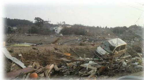
七ヶ浜住宅地の様子