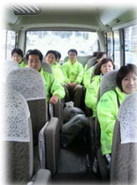
移動中の車内の様子